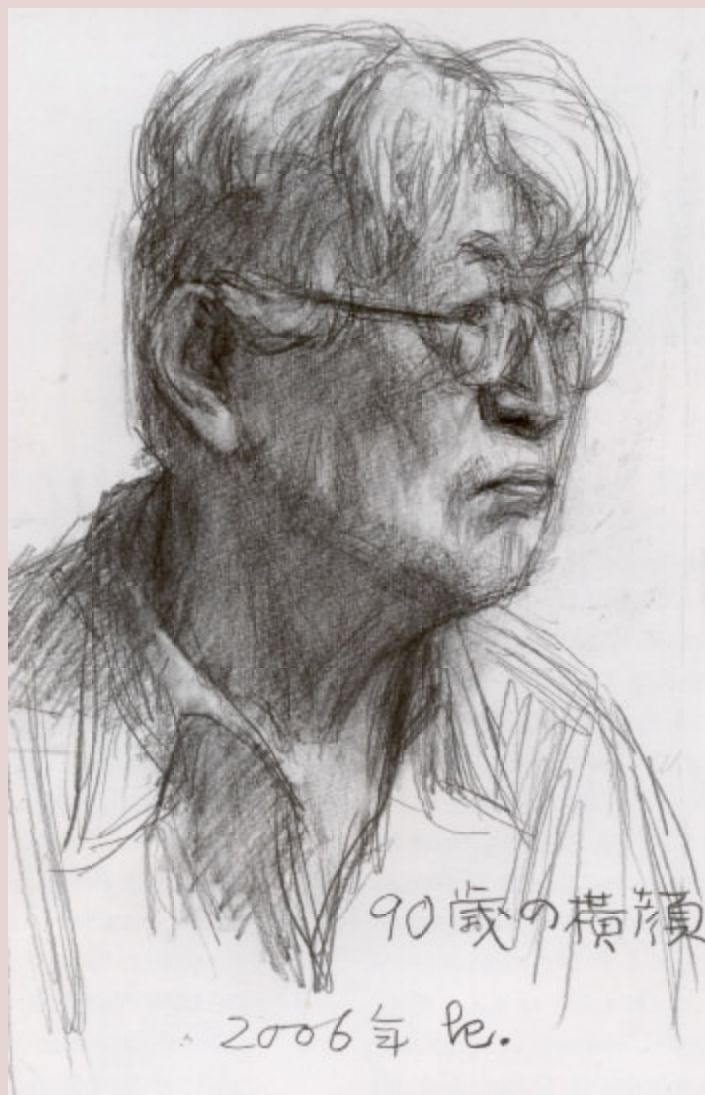
自己プロフィール 30.0x19.8cm