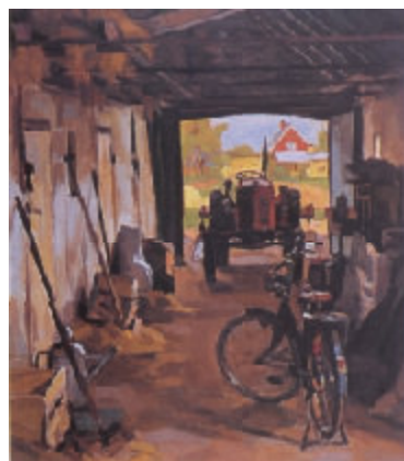
トラクターのある納屋 67.5x58.5